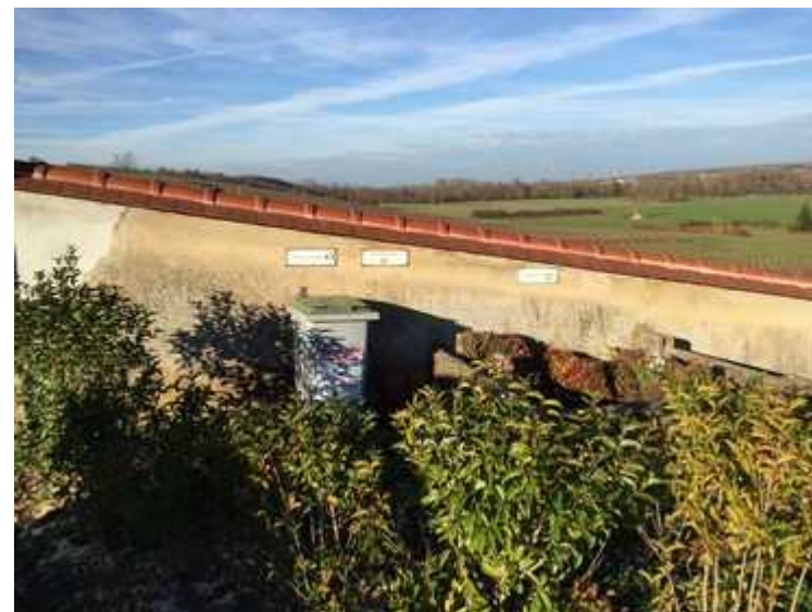
Plateforme de tri selectif