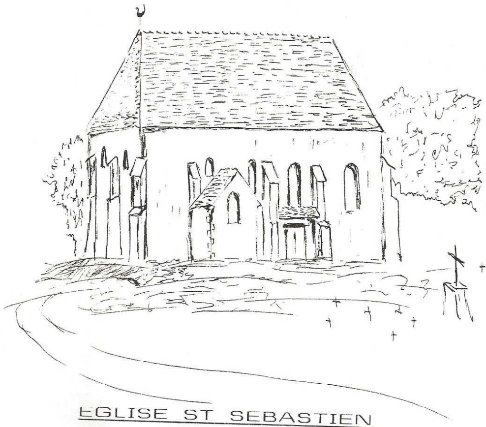
EGLISE ST SEBASTIEN